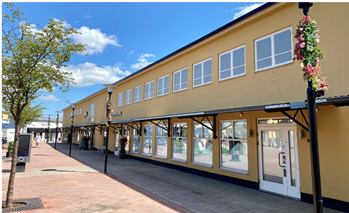
Det gamla flygförrådet.