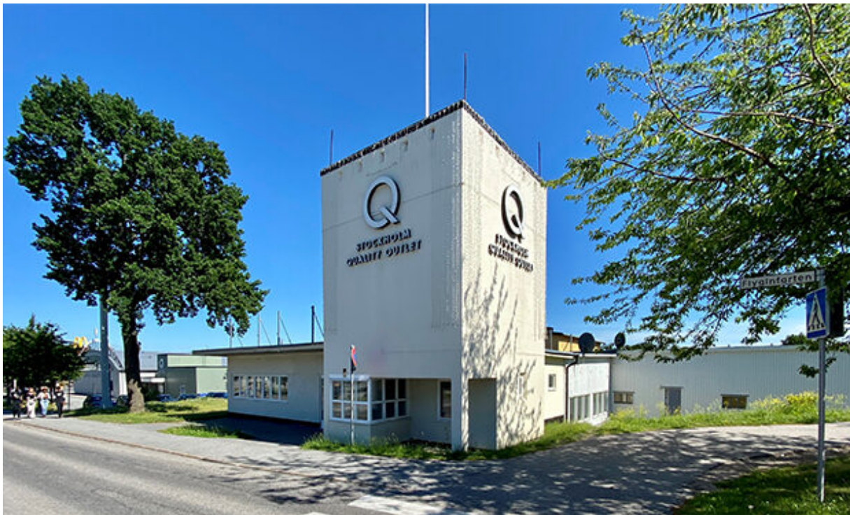
Gamla vakt och arrestbyggnaden i dag.