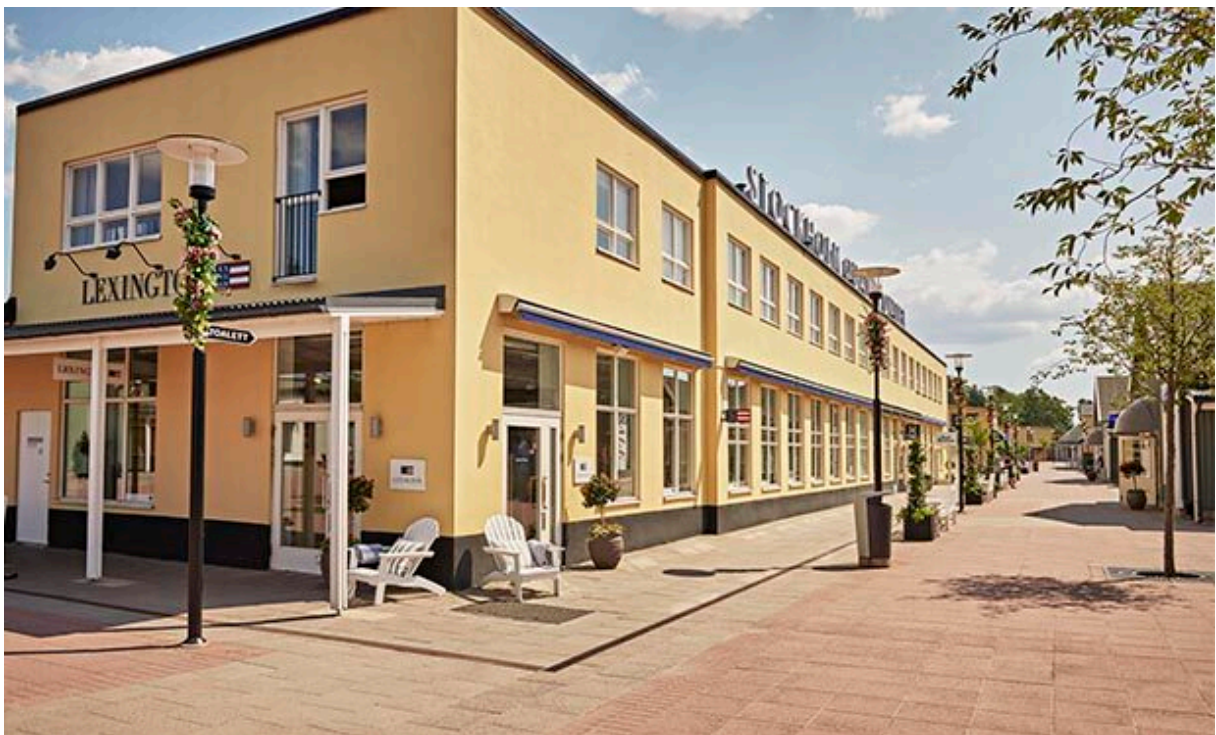
Flygverkstaden inhyser i dag bland annat Lexingtonbutiken.