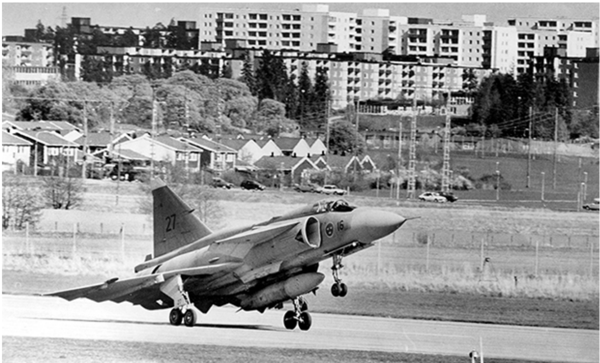
Första JA 37 landar på Barkarby. I bakgrunden ses Akalla.