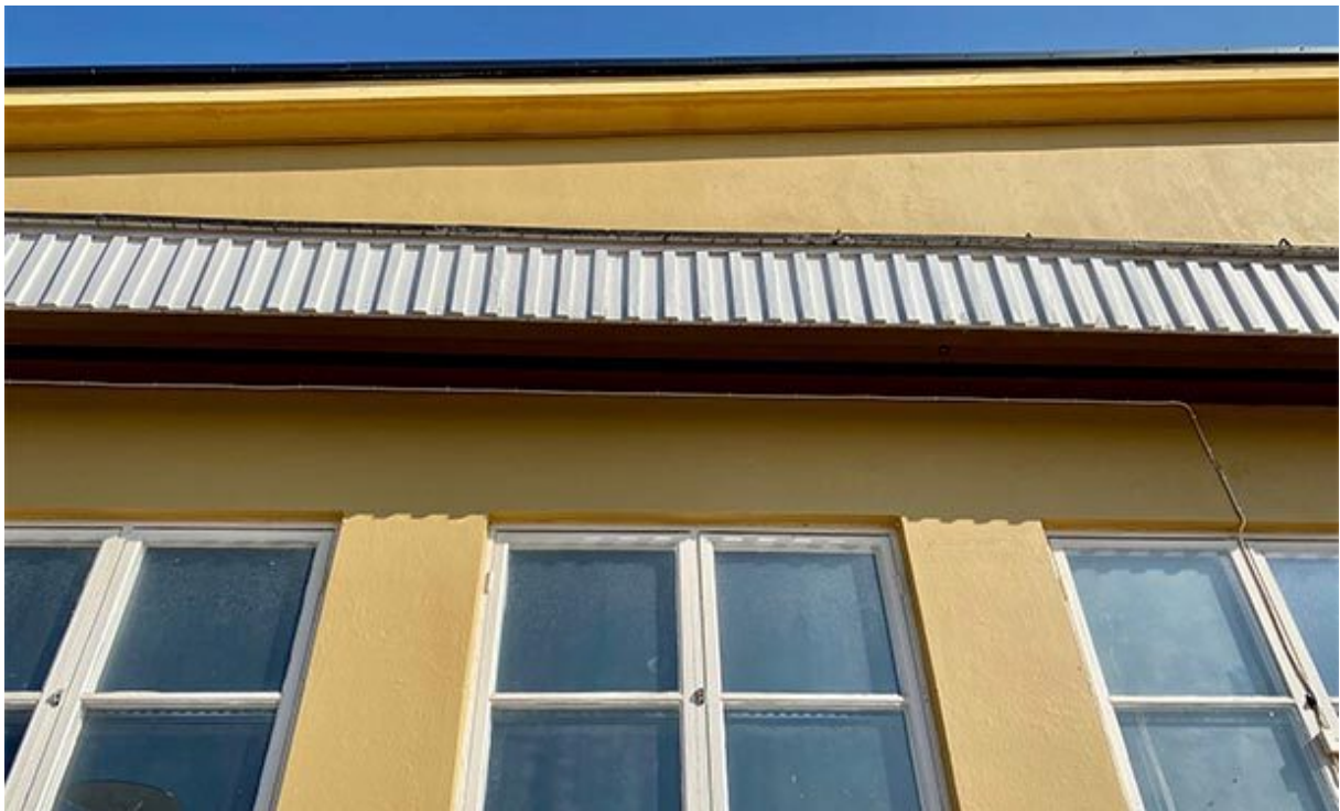
Skenor för stora portar, på gaveln på gamla flygverkstaden.