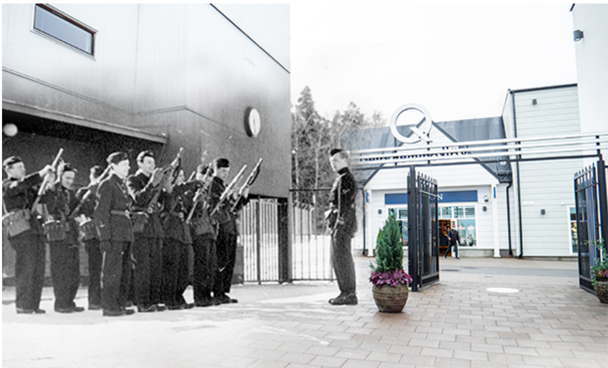
En tanke om hur det kan ha sett ut vid entrén på Stockholm Quality Outlet.