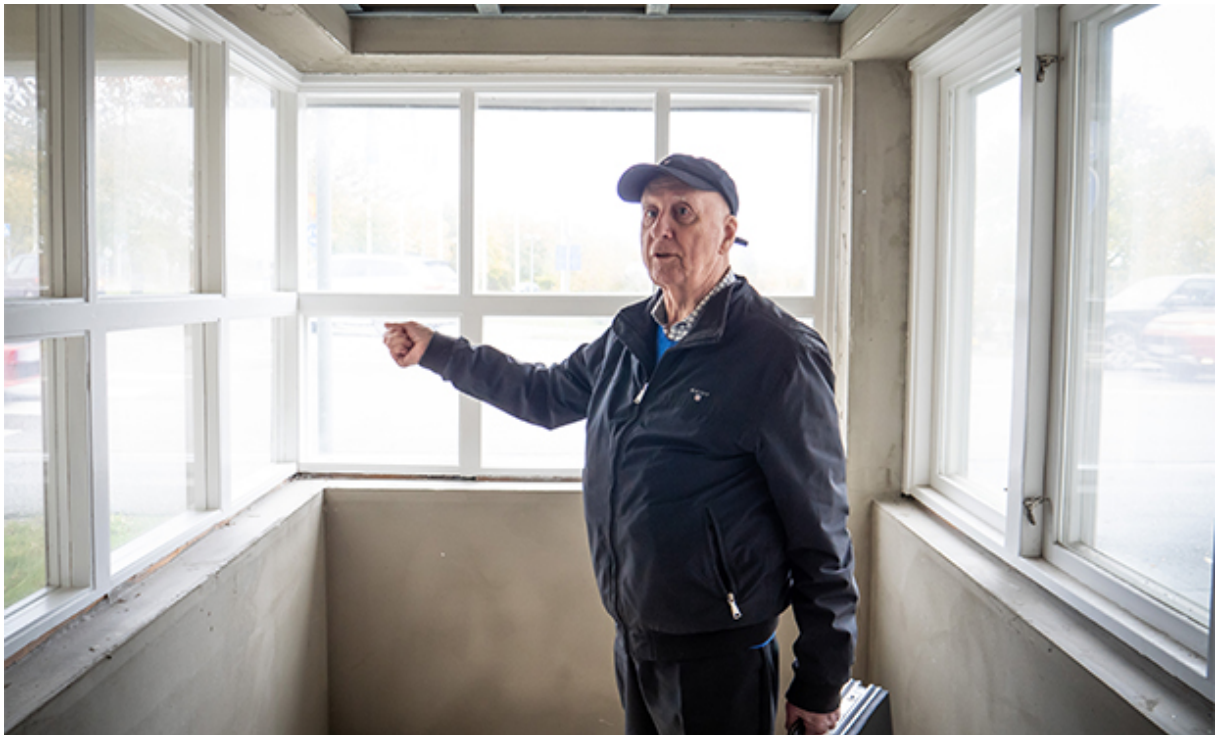
Bosse i den gamla vaktkuren, bredvid arresten.