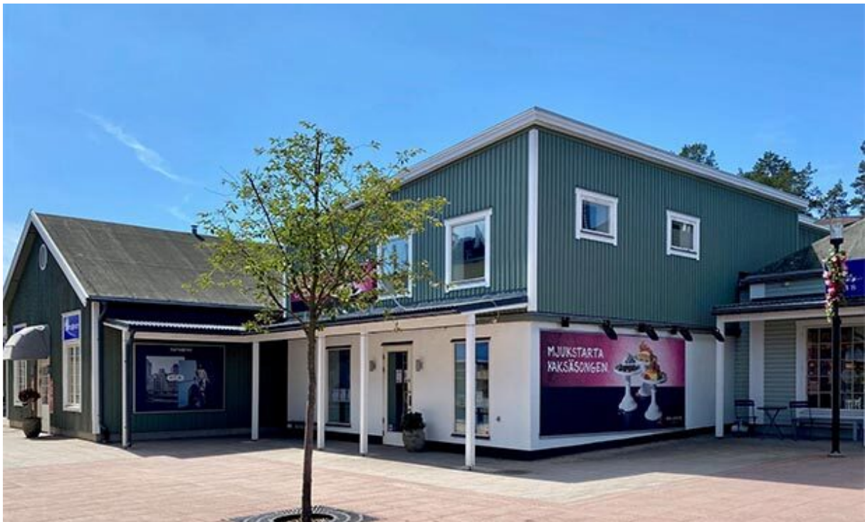
Genom åren har bland annat Delicato haft butik i gamla panncentralen.