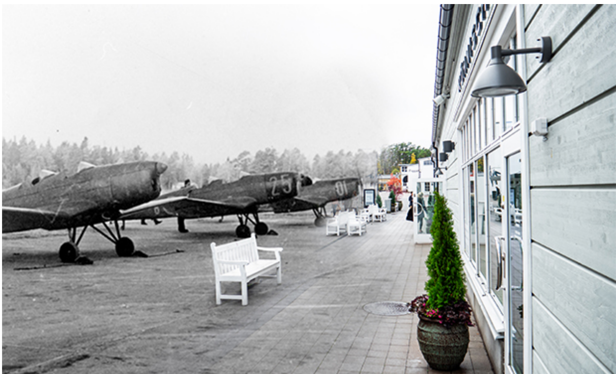
Ett fotomontage från förr och nu på Barkarby. Tre Sk 15 av typ Klemm 35, som användes som skolflygplan i flygvapnet 1940 -4 9.