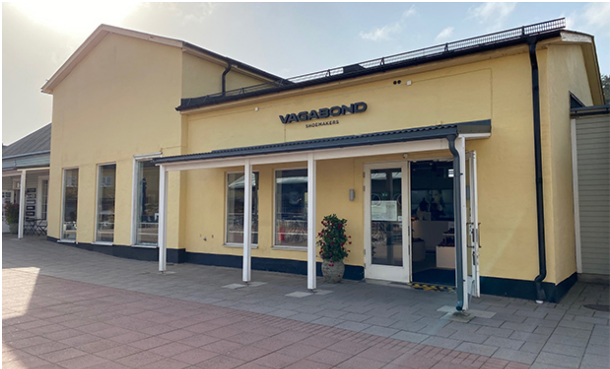
Motorboken från 2020.

Efter ritningar av arkitekt Ture Sellman 1941, lät man bygga underofficersmässen. En byggnad med bostäder för ogifta underofficerare mellan 1943 och 1974, där de intog sina måltider och kaffepauser. Större fester för underofficerarna hölls också här. De första åren präglades av en strikt hierarkisk struktur, där mässarna var uppdelade i de olika befälsgrupperna. Det lättades dock upp på 1980-talet.