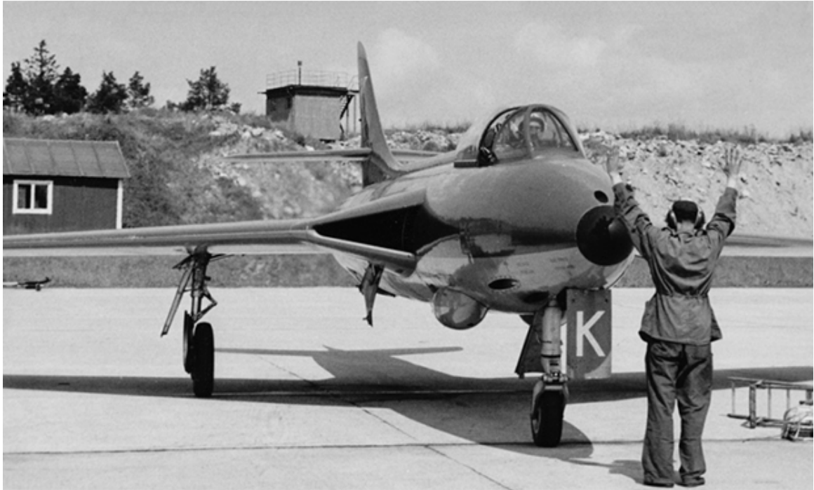
I bildens bakgrund syns väderstationen. Den låg belägen uppe på berget bakom bergsplattan och cirka 200 meter öster om tornet.