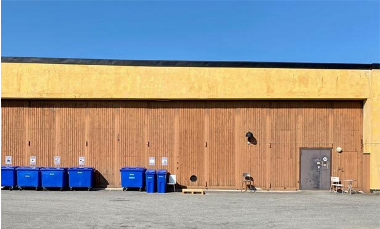
Garageportar på innergården på gamla flygverkstaden.