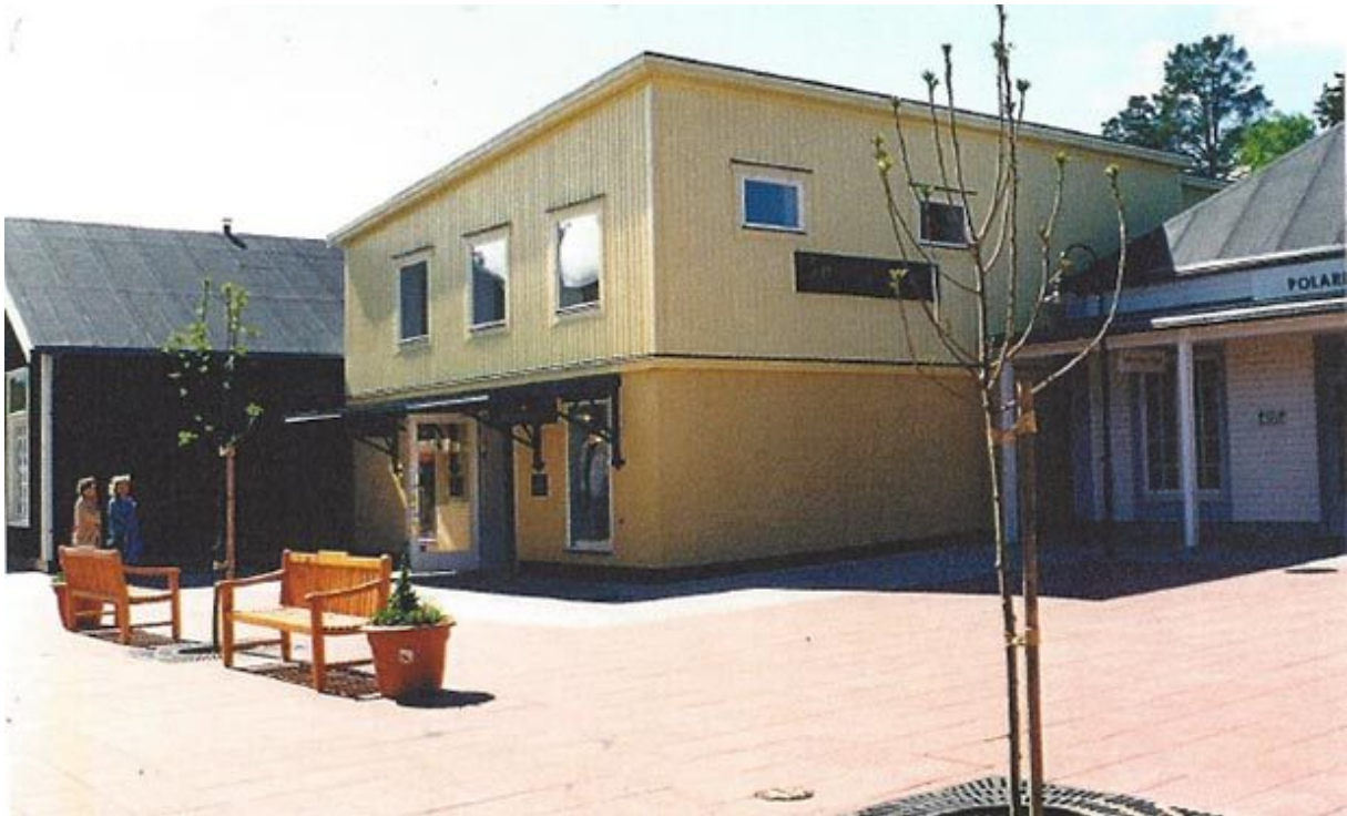
Panncentralen försåg byggnaderna runt flottiljverkstaden med värme och varmvatten.