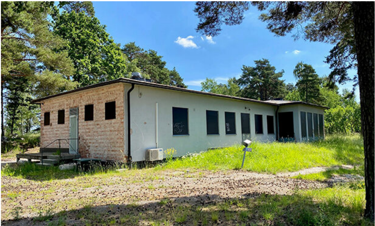
Mässbyggnaden i dag.