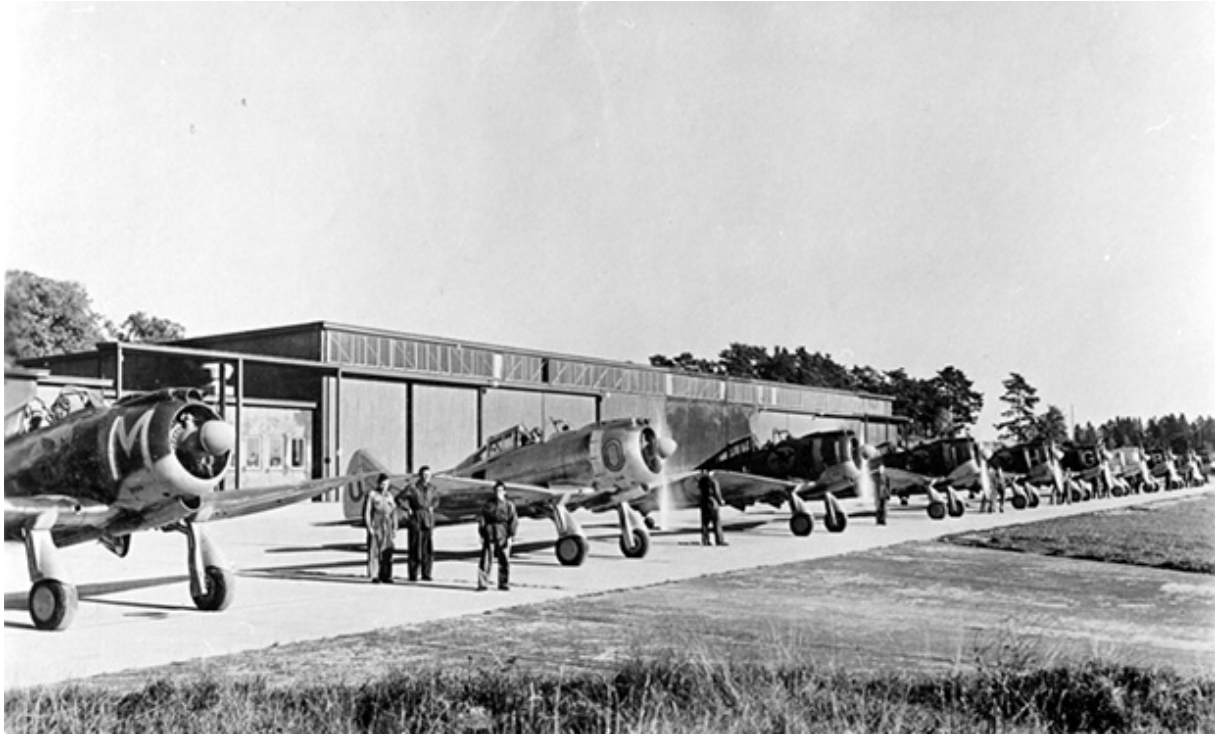
3:e divisionen J9 klara för start.