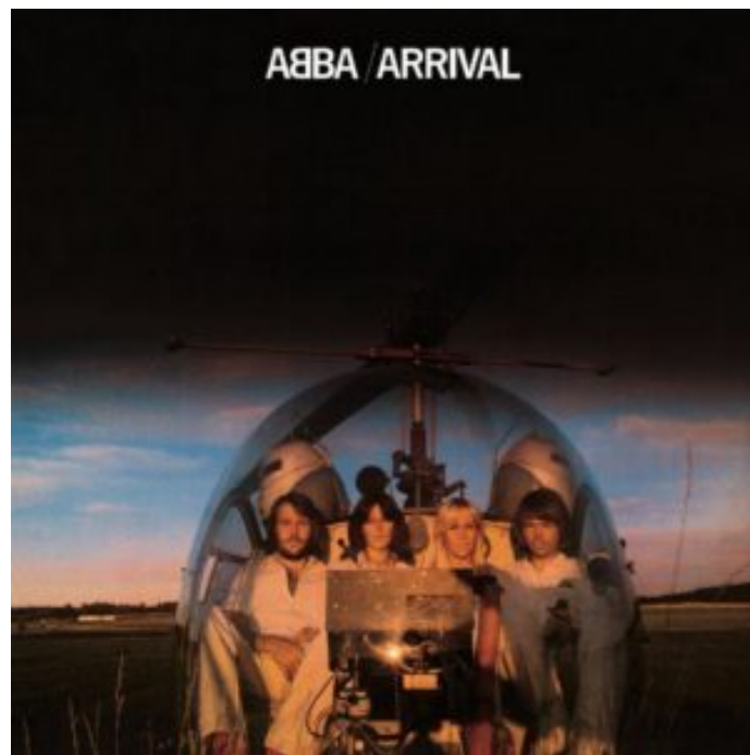
Abbas skiva Arrival från 1976.

Lite kuriosa är att omslagsbilden på ABBA:s album Arrival är fotat i en Bell 47-helikopter, ute på flygfältet här i Barkarby.