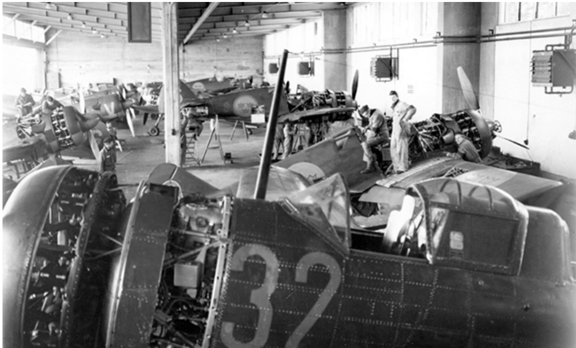
Barkarby flygfält, F8, i full glans med interiör från 2:a divisionens hangar. I förgrunden syns flygplanstyp B 5. I dag är denna stora lokal uppdelad i mindre butikslokaler.