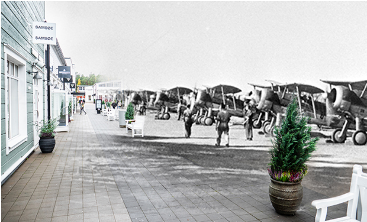
Ett fotomontage på hur det kan ha sett ut på Barkarby.